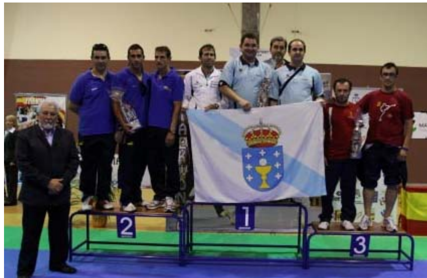
Terceros en la clasificación general