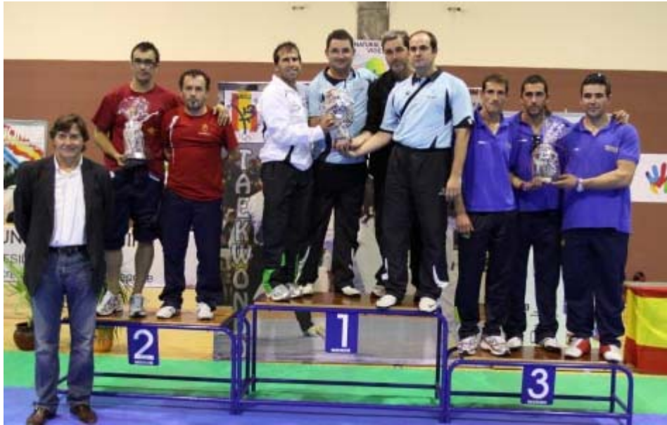
Subcampeones de España en categoría Masculina