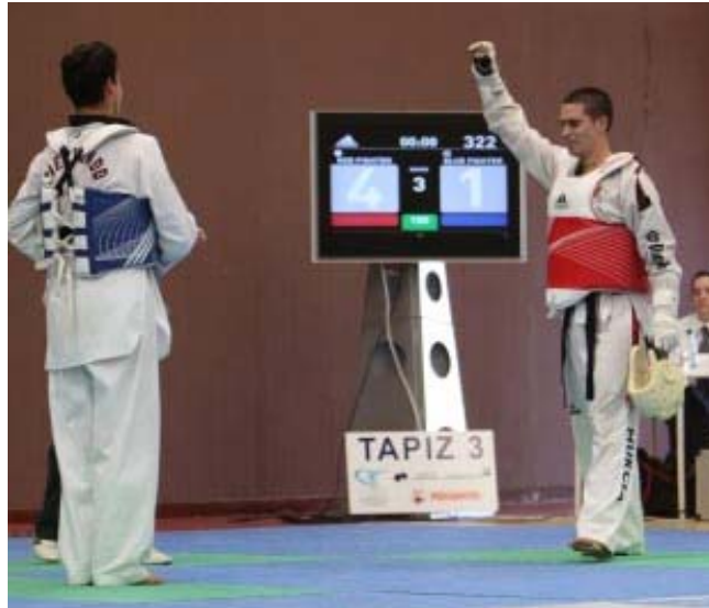
Proclamándose Campeón de España